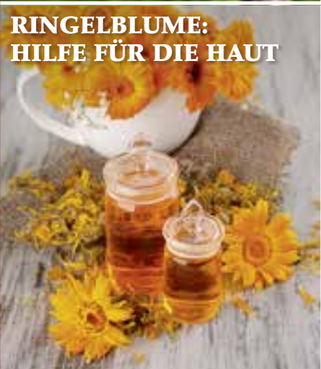
RINGELBLUME: HILFE FÜR DIE HAUT