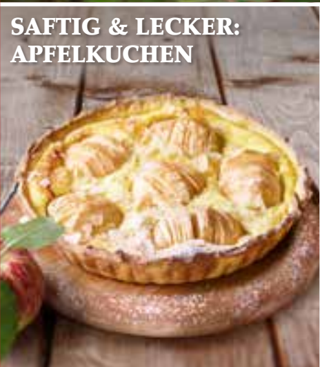
SAFTIG & LECKER: APFELKUCHEN